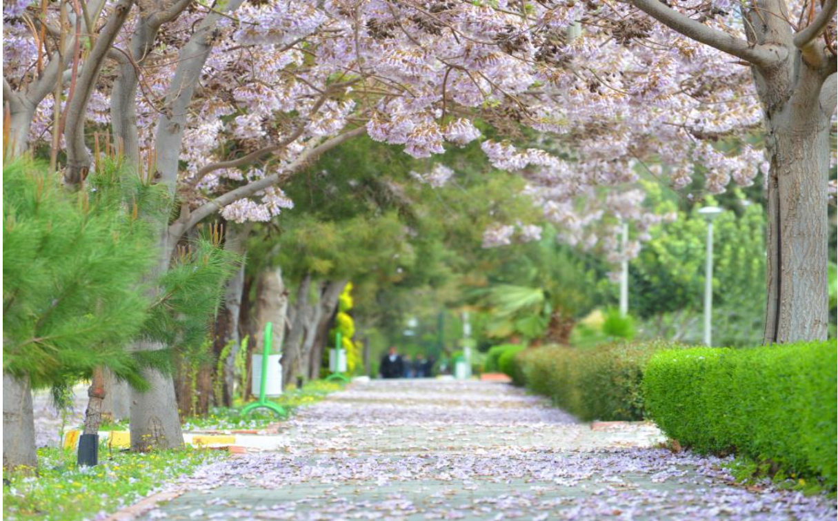
Resim 3: OKÜ Karacaoğlan Yerleşke Alanı İlkbahar