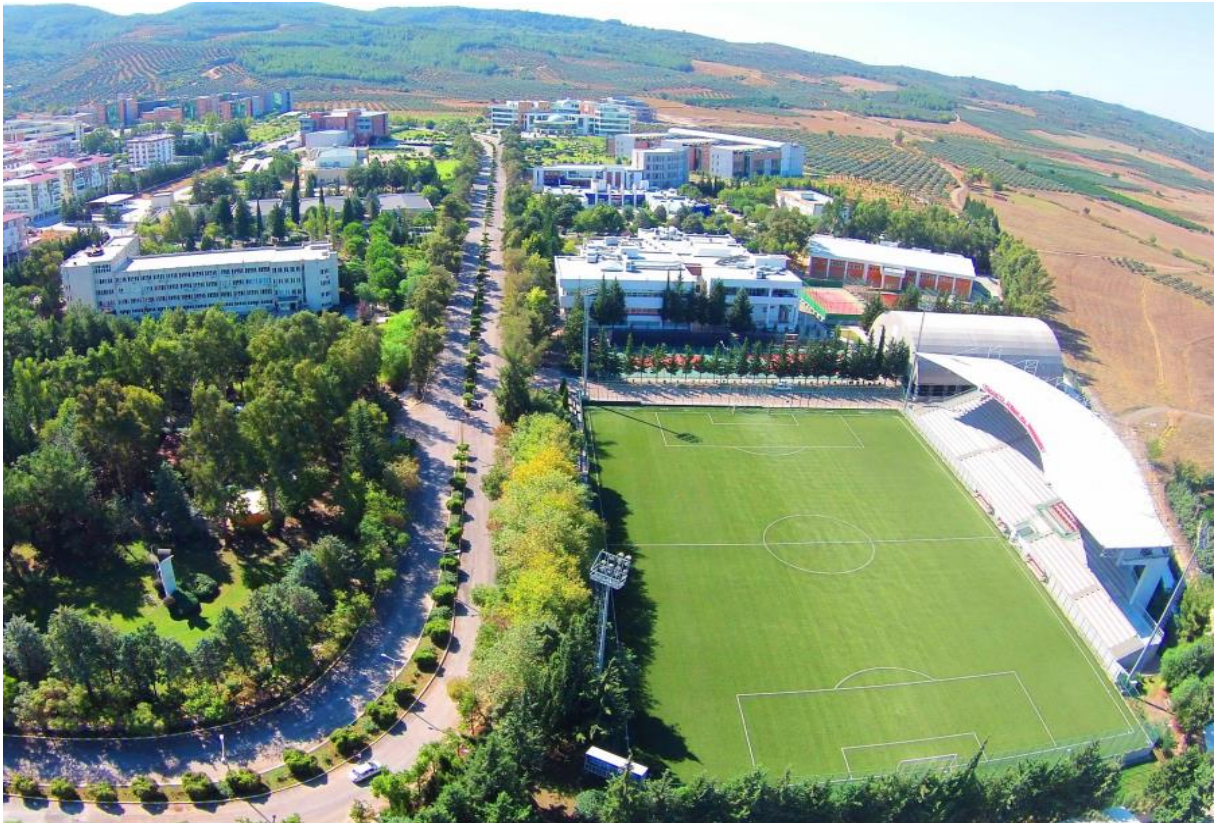
Resim 2: OKÜ Karacaoğlan Yerleşkesi

Osmaniye Korkut Ata Üniversitesinin 2023 yılı itibarıyla sahip olduğu fiziki kapalı alanlar hakkındaki bilgi Tablo 1'de detaylı bir şekilde verilmiştir.