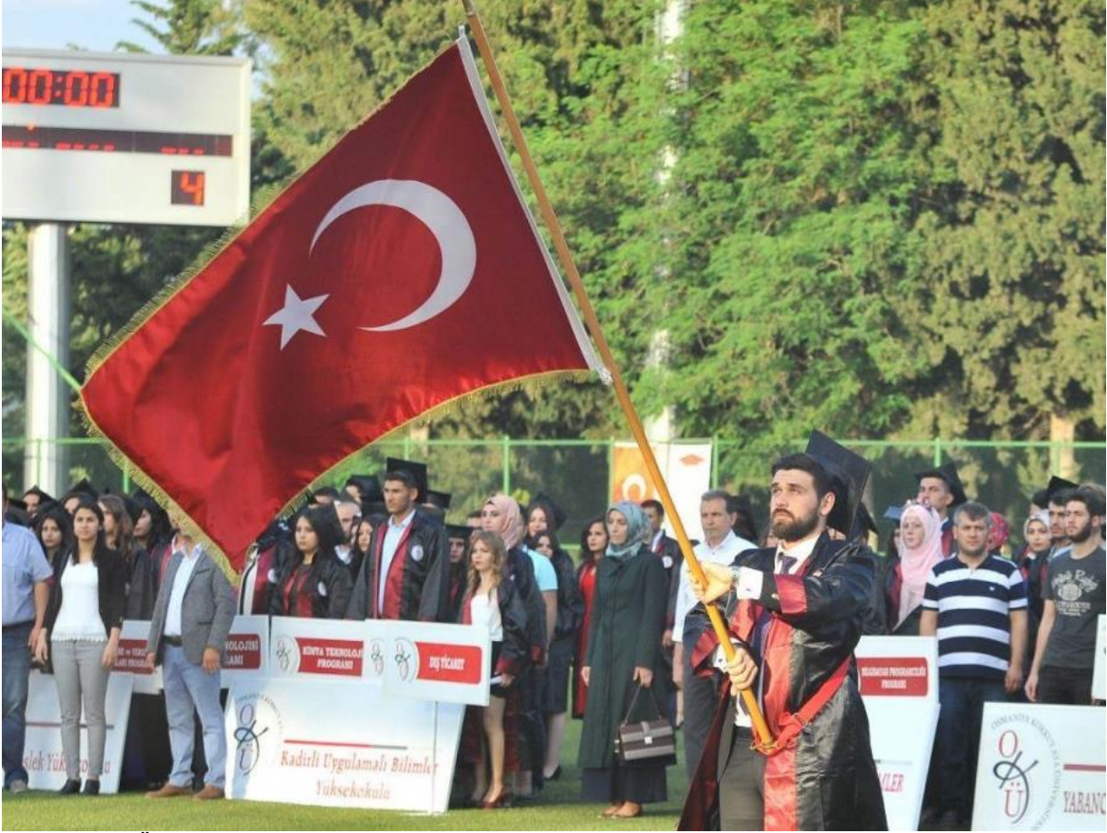
Resim 6: OKÜ Mezuniyet

8- Öğrencilerin ve halkın kullanımına yönelik içerisinde sauna ve buhar hamamı bulunan 1 yarı olimpik yüzme havuzu, halı saha, 2 tenis kortu, FİFA standartlarına uygun çim saha, fitness salonu, 2 squash salonu, çeşitli spor alanları, önlisans, lisans ve lisansüstüne yönelik laboratuvarlar donanımlı çalışma alanları aktif olarak hizmet vermektedir.