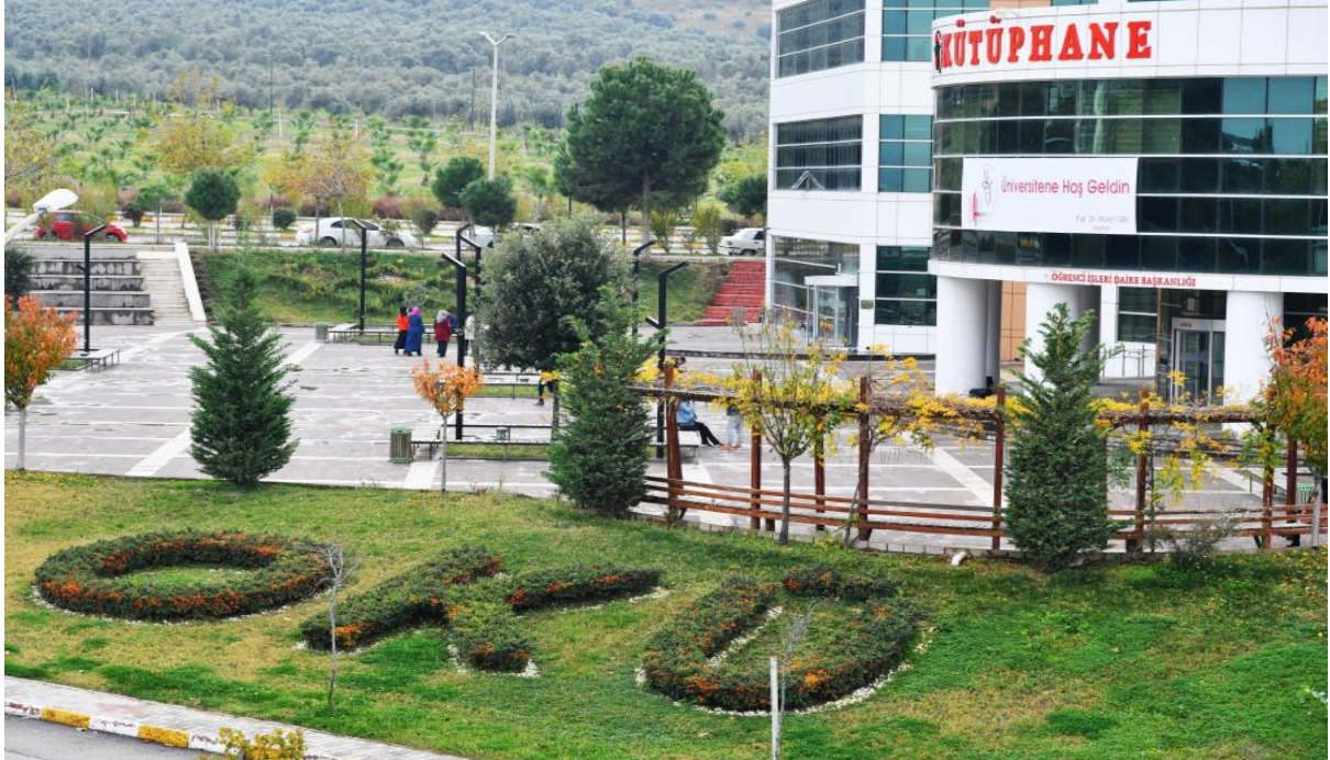
Resim 5: OKÜ Kütüphane