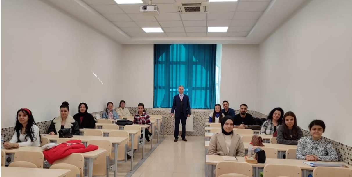
Resim 4: OKÜ TÖMER Katılımcı Sertifika Belge Teslimi

2022-2023 Eğitim-öğretim yılında OKÜ TÖMER'e 5 farklı ülkeden gelen uluslararası öğrenciler 8 ay boyunca Türkçe eğitimi aldı. Bu kurslarda başarı gösteren kursiyerlere B2 ve C1 düzeylerinde sertifikalar verildi. Ayrıca, dil yeterliğini belgelemek üzere OKÜ TÖMER'e başvuran ve yapılan sınavlarda başarılı olan 31 kişiye C1 düzeyinde "Türkçe Yeterlik Sertifikası" verildi. Eylül ayında Osmaniye Korkut Ata Üniversitesi'nin bölümlerine kayıt yaptıran 60 uluslararası öğrenciye 2 ayrı Türkçe Muafiyet Sınavı yapılmıştır.