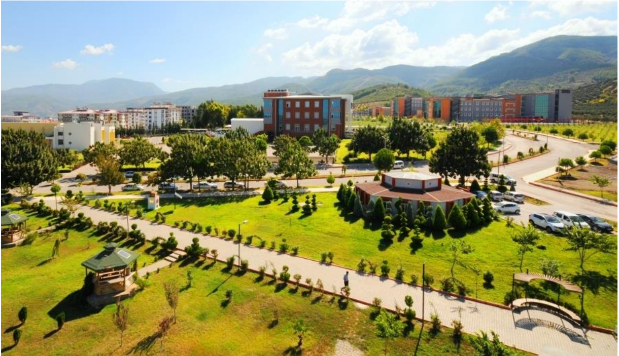
Resim 1: OKÜ Karacaöğlan Yerleşkesi

Yükseköğretim kurumları olarak amacımız; yüksek düzeyde bilimsel çalışma ve araştırma yapmak, bilgi ve teknolojiyi üretmek, bilim verilerini yaymak, ulusal alanda gelişme ve kalkınmaya destek olmak, yurtiçi ve yurtdışı kurumlarla işbirliği yapmak suretiyle bilim dünyasının seçkin bir üyesi haline gelmek, evrensel ve çağdaş gelişmeye katkıda bulunmaktır.